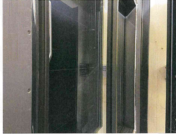
단열성 - 항온실측 사진