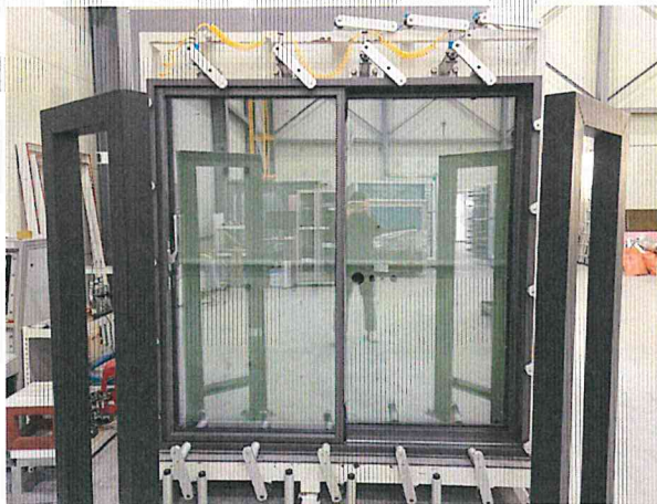
기밀성 - 정면 사진