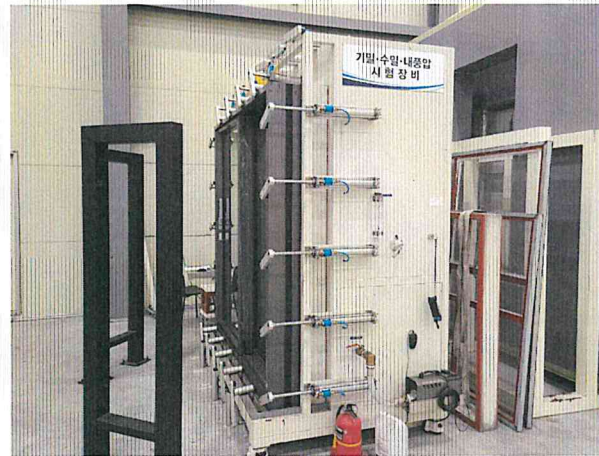
기밀성 - 측면 사진