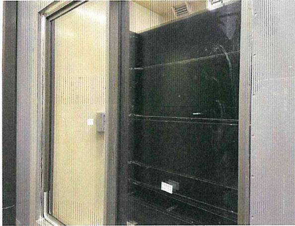
단열성 - 저온실측 사진